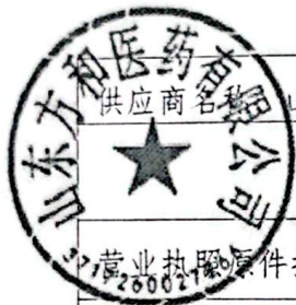
供应商资格审查统计表（包号：1）